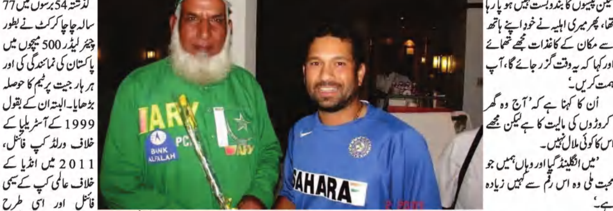
انڈیا میں چرچے اور گونم سدھیر سے دوستی

ان کا کہنا ہے کہ 'آج وہ گھر کر ڈورے کی باریت کا بے گیند مجھے اس کا کوئی لالہ نہیں۔' میں انگلینڈ گیا اور وہاں ہمیں جو محبت ملی وہ اس رقم سے نہیں زیادہ ہے۔