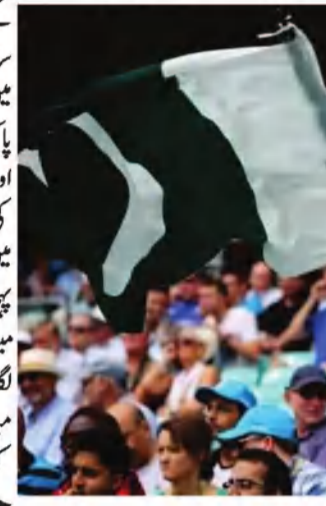
جلوید میانداہ کا تاریخی جھکا اور دو سو کلو متیانی۔۔۔