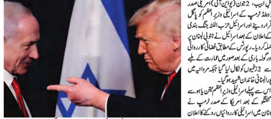
ڈونالڈ ٹرمپ نے کہا ہے کہ اسرائیلی وزیر اعظم نتن یاہو کو پاگل کہنے کے بعد اسرائیل نے جنوبی لبنان پر حملہ کیا۔

تل ابیب، 2 جون (یو این آئی) اسرائیلی وزیر اعظم نتن یاہو نے کہا ہے کہ اسرائیلی فوج جنوبی لبنان میں منصوبے کے مطابق اپنی کارروائیاں جاری رکھے گی۔ نتن یاہو نے کہا ہے کہ اسرائیلی فوج جنوبی لبنان میں منصوبے کے مطابق اپنی کارروائیاں جاری رکھے گی۔ نتن یاہو نے کہا ہے کہ اسرائیلی فوج جنوبی لبنان میں منصوبے کے مطابق اپنی کارروائیاں جاری رکھے گی۔