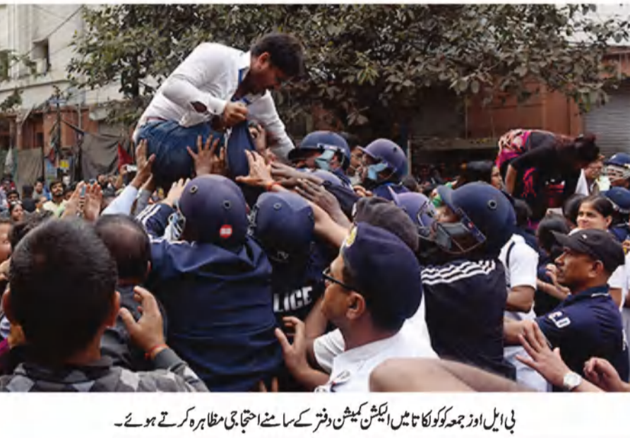
بی ایل اوز جھوٹا کولکاتا میں ایکشن کمیشن دفتر کے سامنے احتجاجی مظاہرہ کرتے ہوئے۔