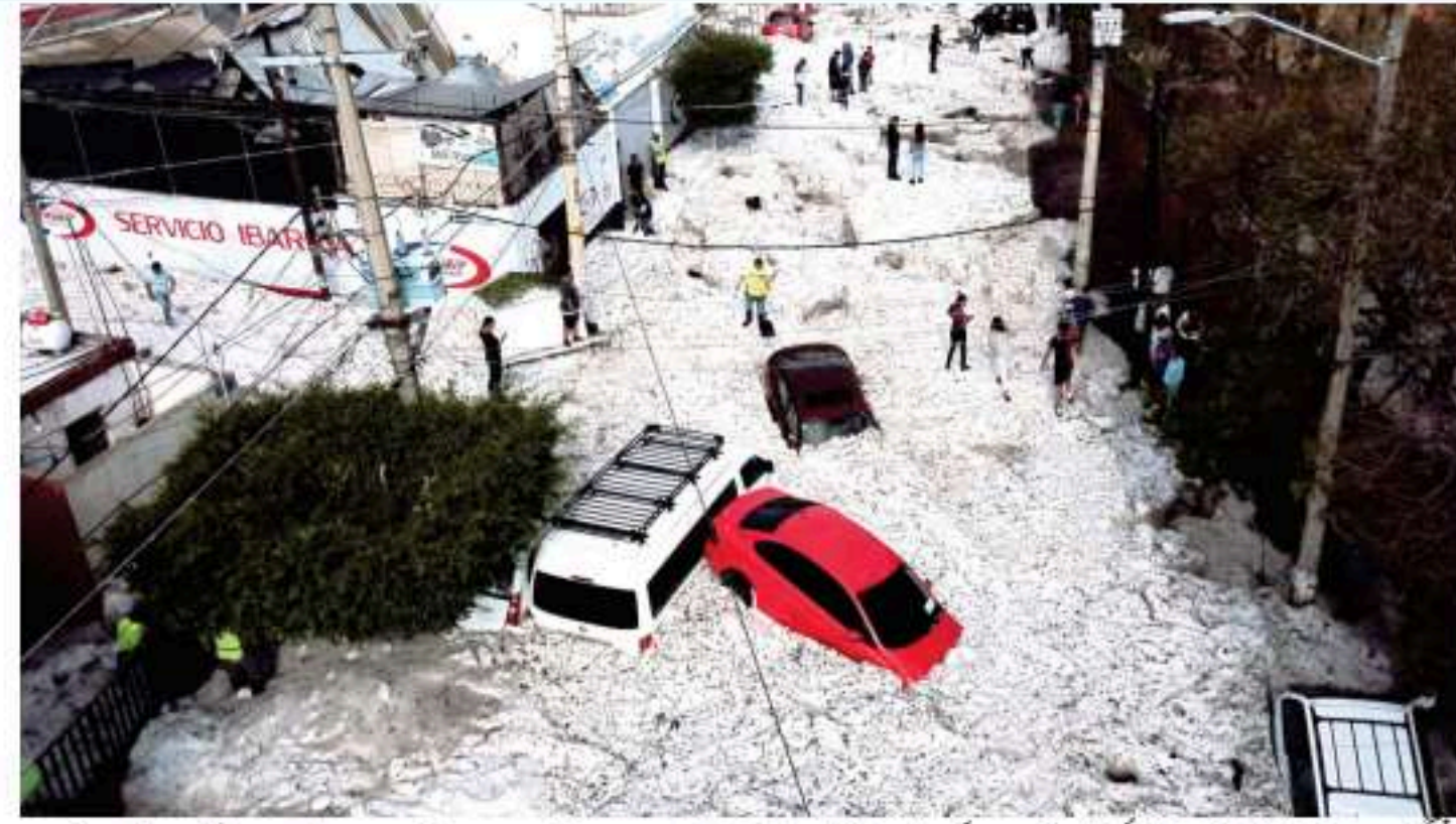
واشنگٹن، 29 جنوری (یو این آئی) امریکہ میں برفانی طوفان کا سلسلہ نہ ختم ہوا۔ مختلف حادثات میں ہلاکتوں کی تعداد 50 تک جا پہنچی، اب تک ہزاروں پروازیں منسوخ کی جا چکی ہیں۔ امریکہ میں برفانی طوفان نے تباہی مچادی، واشنگٹن، نیویارک کے باعث مختلف حادثات واقعات میں

بروازیں منسوخ ہوئیں، آرنکساس سے نیو انگلینڈ تک ایک فٹ سے زائد برف پڑ چکی ہے، شدید خراب موسم کے باعث سڑکیں اور کھلی اوارے بند کر دیئے گئے۔ بارش اور برفانی طوفان کے باعث وکس لاکھ سے زائد افراد بجلی سے محروم ہیں، محکمہ موسمیات نے خبردار کیا ہے کہ آئندہ دنوں میں مزید شدید سردی اور ٹھنڈے طور پر ایک اور برفانی طوفان شمالی ساحلی علاقوں کو متاثر کر سکتا ہے۔ امریکی میڈیا کی رپورٹ کے مطابق شمالی ریاستوں میں درجہ حرارت ریکارڈ تک گریگا، درجہ حرارت کم فروری تک نقطہ انجماد سے نیچے رہنے کا امکان ہے۔ اوہر کینیڈا میں بھی شدید برف باری کا سلسلہ جاری ہے، ٹورنٹو اور اونٹاریو کے جنوبی علاقے برف سے ڈھک گئے، شدید برف باری کے باعث اسکول بند کر دیئے گئے۔ کینیڈا میں بھی خراب موسم کے باعث ہزاروں پروازیں منسوخ ہوئیں۔ حکام نے شہریوں کو گھروں میں رہنے کی ہدایت کردی ہے۔