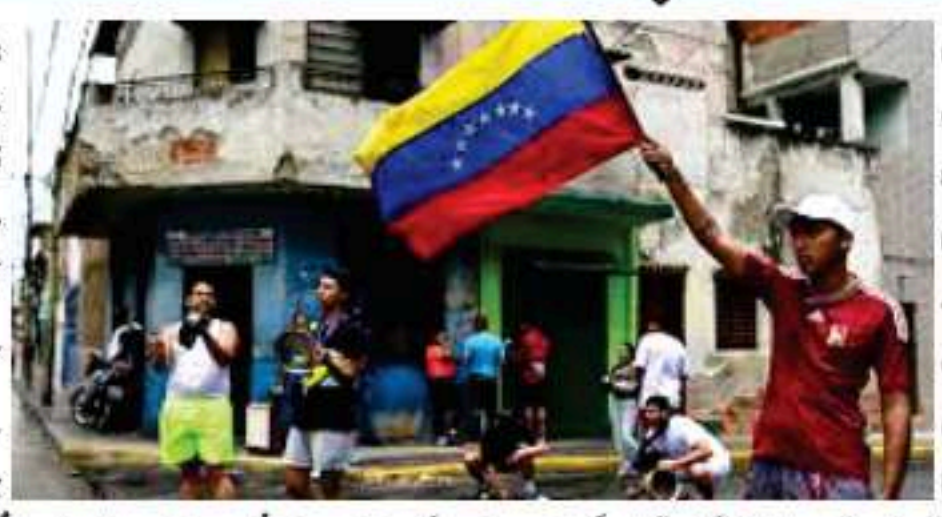
نئی دہلی، 4 جنوری (یو این آئی) ہندوستان نے اتوار کے روز ویزویلا میں حالیہ واقعات پر "گہری تشویش" کا اظہار کیا اور کہا کہ وہ جنوبی امریکی ملک میں ابھرتی ہوئی سکینوری صورتحال پر قریبی نظر رکھے ہوئے ہے۔ وزارت خارجہ کی جانب سے جاری ایک بیان میں حکومت نے ویزویلا کے عوام کی سلامتی اور فلاح و بہبود کے لیے اپنے عزم کا اعادہ کیا اور تمام فریقین سے اپیل کی کہ وہ خطے میں امن و استحکام کو برقرار رکھتے ہوئے مذاکرات کے ذریعے بحران کا پرامن حل تلاش کریں۔ بیان میں یہ بھی یقین دہانی کرائی گئی کہ کاراکاس میں ہندوستانی سفارت خانہ وہاں تقیم ہندوستانی برادری سے مسلسل رابطے میں ہے اور اس نازک دور میں ہر ممکن مدد فراہم کرتا رہے گا۔ یہ اعلان وزارت خارجہ کی جانب سے ہفتہ کے روز جاری کردہ ایک ہنگامی ایڈوائزری کے بعد سامنے آیا ہے، جس میں ہندوستانی شہریوں کو ویزویلا کے غیر ضروری سفر سے سختی سے منع کیا گیا تھا۔ ایڈوائزری میں ویزویلا میں موجود ہندوستانیوں کو ہدایت دی گئی ہے کہ وہ چوکس رہیں، عوامی اجتماعات سے گریز کریں، گھروں کے اندر رہیں اور اپنی حفاظت کے لیے متناہی سفر ضرور دیکھیں۔ ایڈوائزری ویزویلا کی سکینوری صورتحال میں اپنا چابک تہذیبی کے باعث جاری کی گئی ہے۔ ان حملوں میں دارالحکومت کاراکاس کے اہم فوجی ٹھکانوں کو نشانہ

بنایا گیا، جن میں فورے تینا فوجی پمپکس بھی شامل ہے۔ امریکی صدر ڈونلڈ ٹرمپ نے تصدیق کی کہ امریکی افواج نے ویج پیمانے پر حملہ کیا ہے اور دعویٰ کیا کہ ویزویلا کے صدر نکولس مادورو اور ان کی اہلیہ سیلینا فلورینس کو حراست میں لے کر ملک سے باہر منتقل کر دیا گیا ہے۔ وزارت خارجہ نے ویزویلا میں تقیم ہندوستانی شہریوں کے لیے رابطہ تفہیلات جاری کرتے ہوئے انہیں سفارت خانے سے مسلسل رابطے میں رہنے کی ہدایت دی ہے، ای میل cons.caracas@mea.gov.in (کارا اور واٹس ایپ) 58-412-9584288 پر صورتحال عالمی توجہ کا مرکز بنی ہوئی ہے، جبکہ چین اور برطانیہ سمیت دیگر بڑی طاقتوں نے بھی وارننگ جاری کی ہے اور ویزویلا میں ممکنہ اقتدار کے خلاف یا خاندان کے خطرات پر گہری نظر رکھے ہوئے ہیں۔ صدر ٹرمپ نے کہا ہے کہ ویزویلا پر کنٹرول "عموری منظمی" کی "برقرار رکھا جائے گا، اور ایک پریس کانفرنس میں انہوں نے کہا کہ "ہم زمینی افواج تعینات کرنے سے نہیں ڈرتے،" جس سے مزید فوجی مداخلت کے امکان کا تاثر ظاہر ہوتا ہے۔ وزارت خارجہ کا کہنا ہے کہ وہ صورتحال پر گہری نظر رکھے ہوئے ہے اور خطے کی سکینوری میں کئی بھی تہذیبی کے بارے میں بروقت معلومات فراہم کرنے کے لیے تیار ہے۔